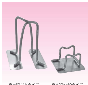
※H50以上タイプ ※H20~40タイプ