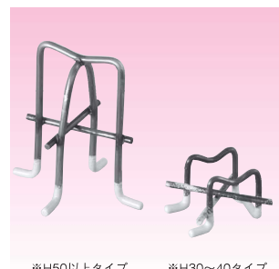
※H50以上タイプ ※H30~40タイプ