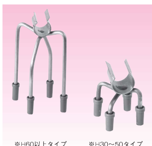
※H60以上タイプ ※H30~50タイプ