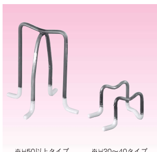
※H50以上タイプ ※H20~40タイプ