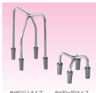
※H60以上タイプ ※H30~50タイプ